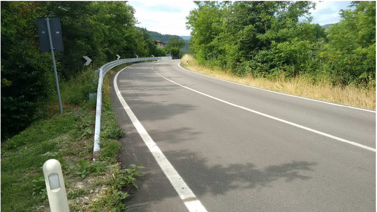
PONTE SUL RIO CURRADA AL KM 32+450 DELLA SP513R SITUAZIONE ATTUALE DOPO L'INCIDENTE SUL LATO DI VALLE: