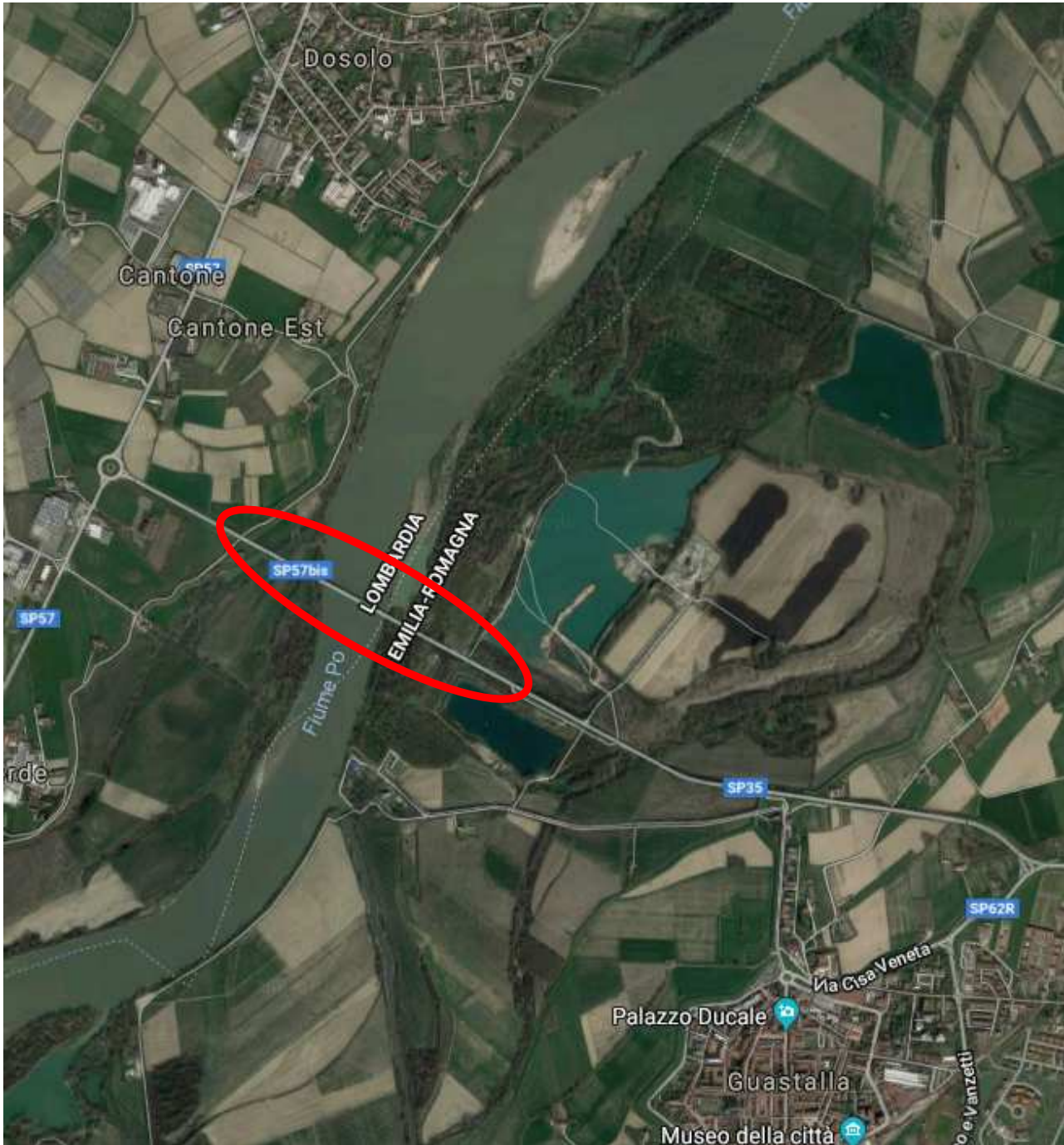
Figura 1 – Localizzazione del Manufatto.

Il manufatto risulta posto tra Dosolo e Guastalla al confine al confine tra la Provincia di Reggio Emilia (S.P. 35 Guastalla - Ponte Po) e la Provincia di Mantova (S.P. 93), su un'arteria viaria di connessione strategica tra le due Province.