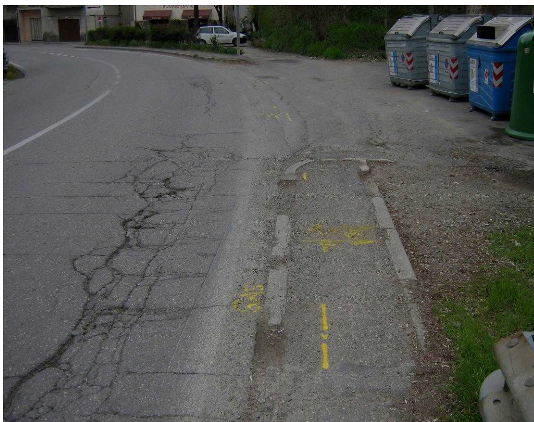
Foto 01: area in cui sarà realizzata la fondazione su sponda destra del Rio Vico. Vista della SP 513 R verso San Polo d'Enza.