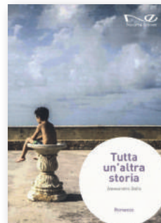
SCRITTURA DI LEGALITÀ TUTTA UN'ALTRA STORIA [Ed. Navarra]