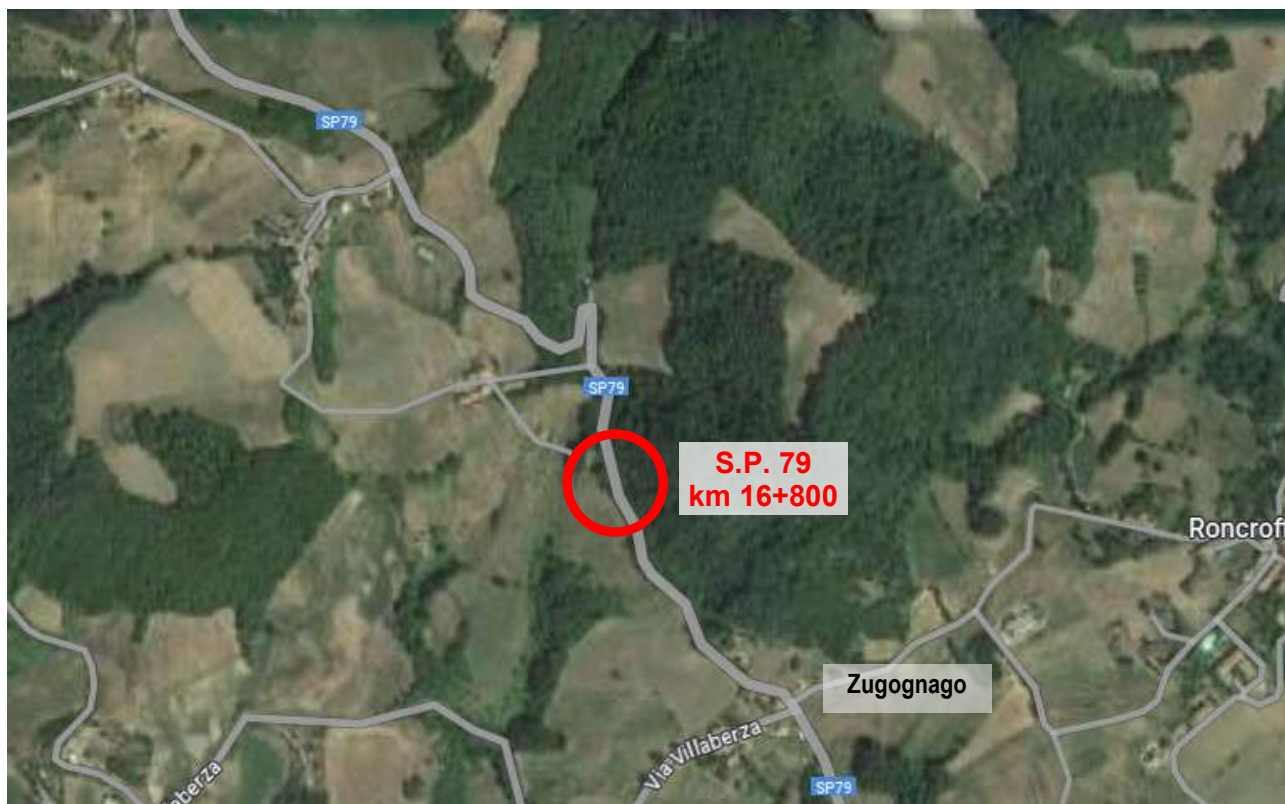
Figura 1 – Vista aerea dell'area oggetto di intervento.

L'intervento consiste nella messa in sicurezza della strada provinciale attraverso un rafforzamento corticale della scarpata di monte, così come descritto nel capitolo 3 seguente, al fine di preservarne la consistenza ed eliminare il rischio di caduta di materiale in carreggiata, garantendo così la sicurezza per la viabilità.