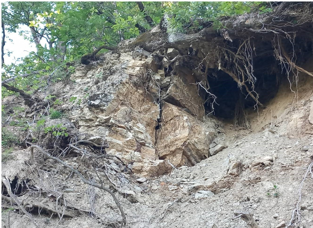
Foto 4 – Particolare del materiale lapideo ritenuto ancora instabile.

Gli elaborati redatti a corredo del progetto esecutivo in oggetto sono i seguenti: