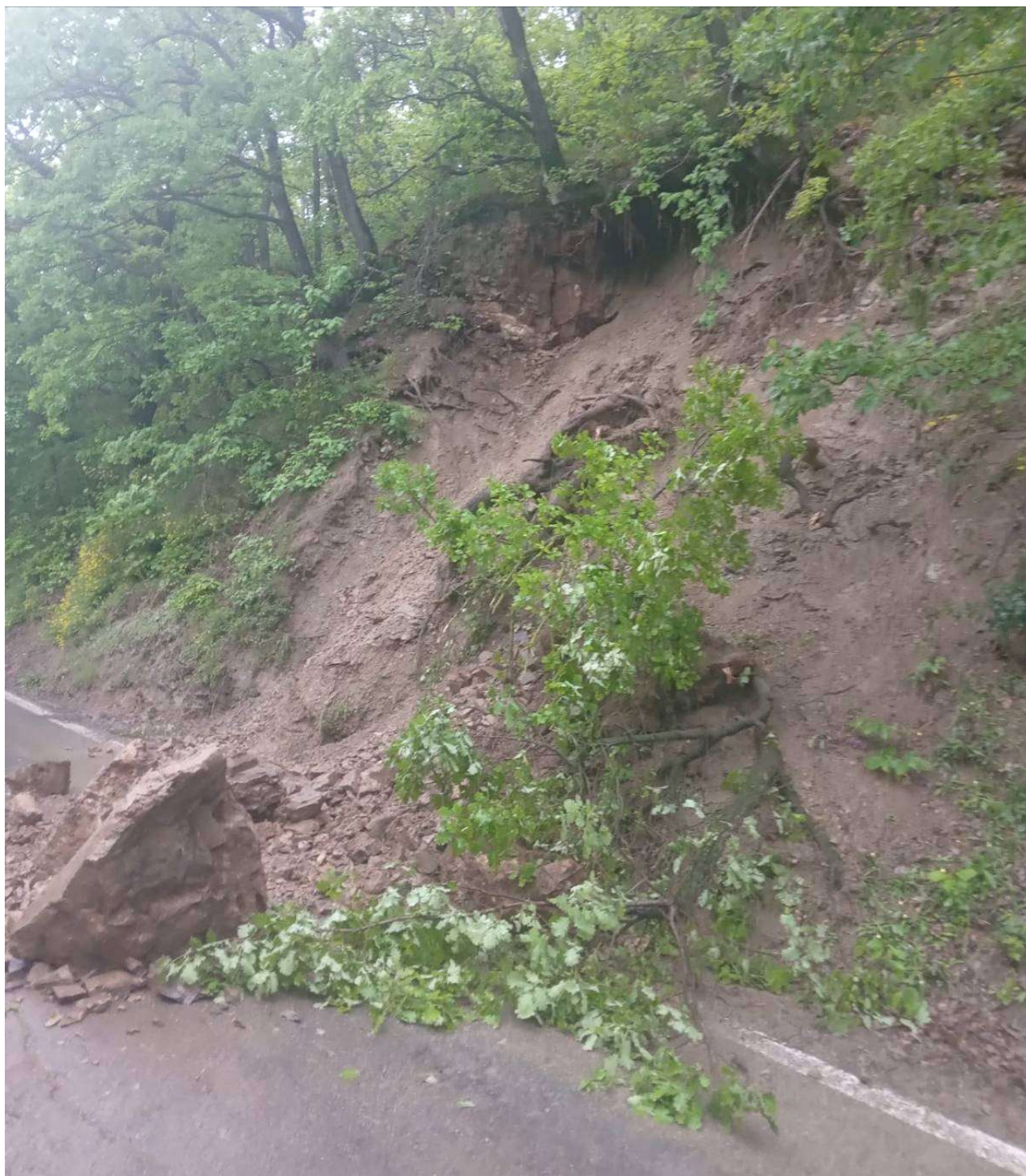
Foto 1 – Particolare dei massi e del detrito crollati sulla strada provinciale 79 durante le fasi dell'evento.