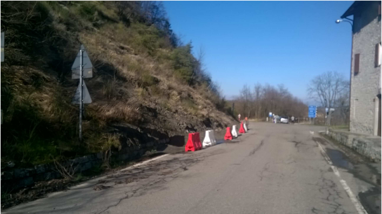
Foto 1 – Vista da sud del tratto di strada interessato dal dissesto.