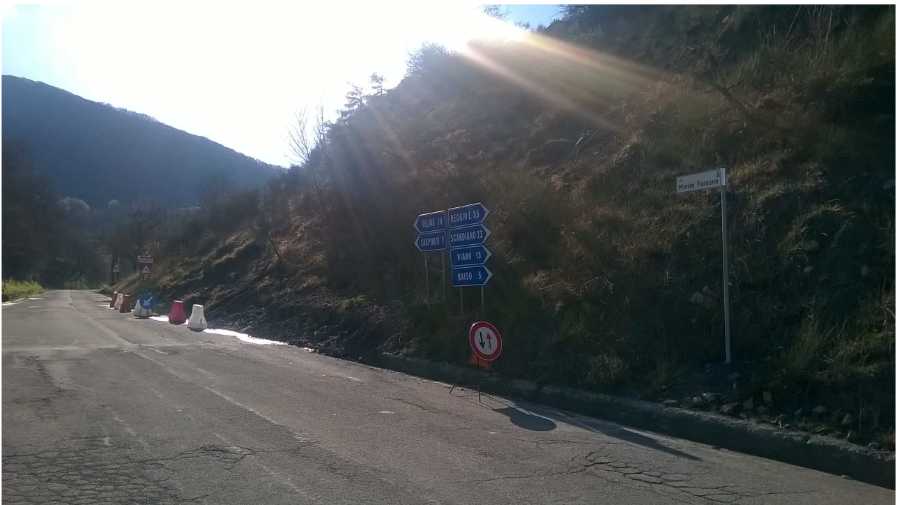
Foto 2 – Vista da nord del tratto di strada interessato dal dissesto.