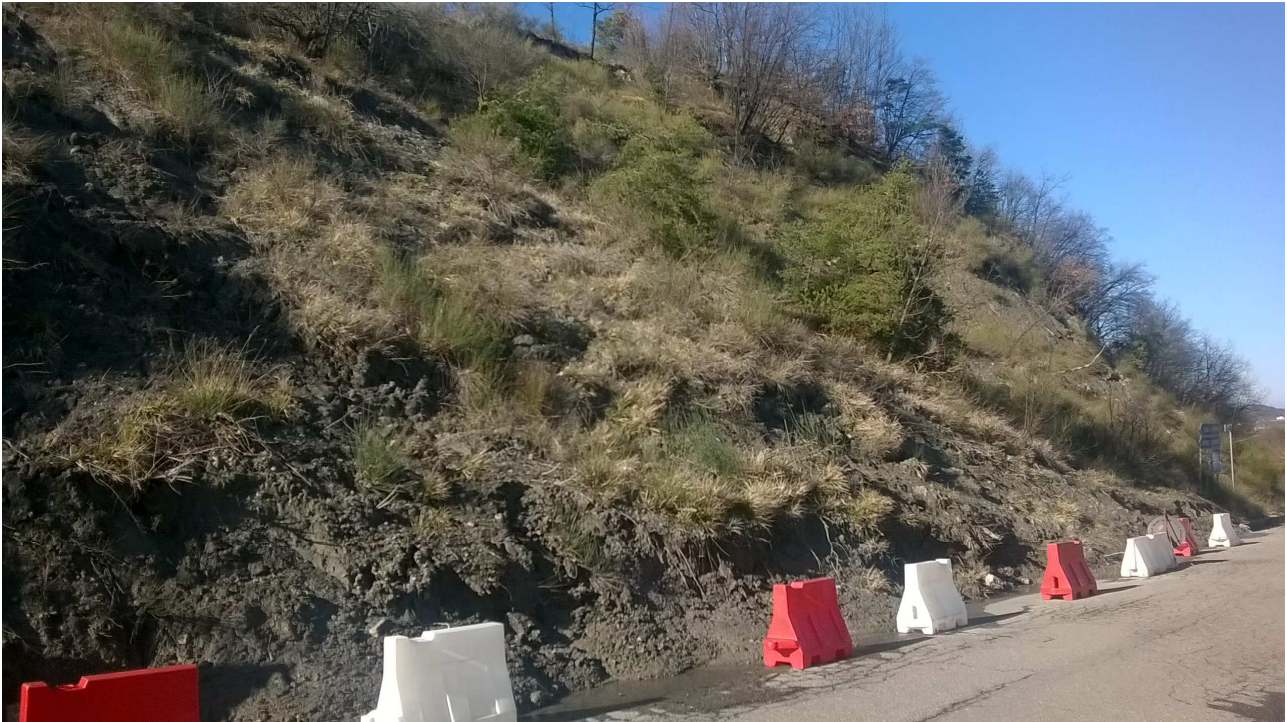
Foto 3 – Particolare del pendio a monte del settore centrale del tratto di strada interessato dal dissesto.