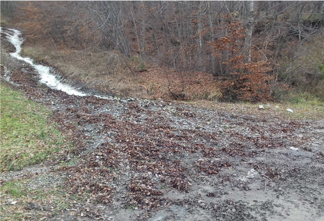
Foto 2 – Particolare del corso d'acqua uscito dall'alveo e del materiale trasportato.