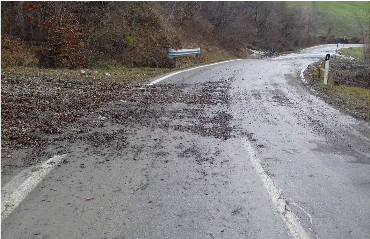
Foto 1 – Vista dell’esondazione a causa delle precipitazioni intense del dicembre 2017, con trasporto di terreno e detriti sulla sede stradale.