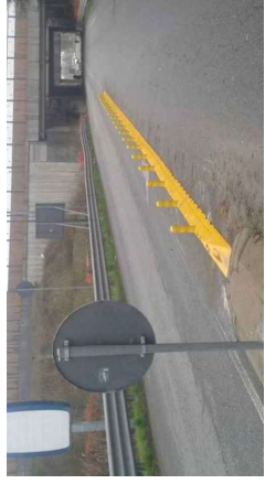
ESEMPIO INSTALLAZIONE CORDOLO DELIMITATORE DI CORSA IN GOMMA