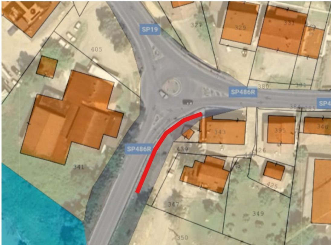
Figura 2 – Vista aerea dell'area oggetto su mappa catastale. In rosso la zona di realizzazione del muro in c.a..