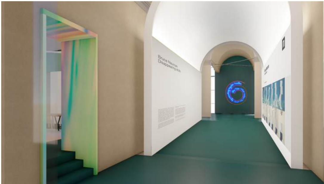
Vista dall'ingresso principale

Il piano terra è quindi dedicato ad esperienze differenti, immersive, sociali e di aggregazione a disposizione della città.