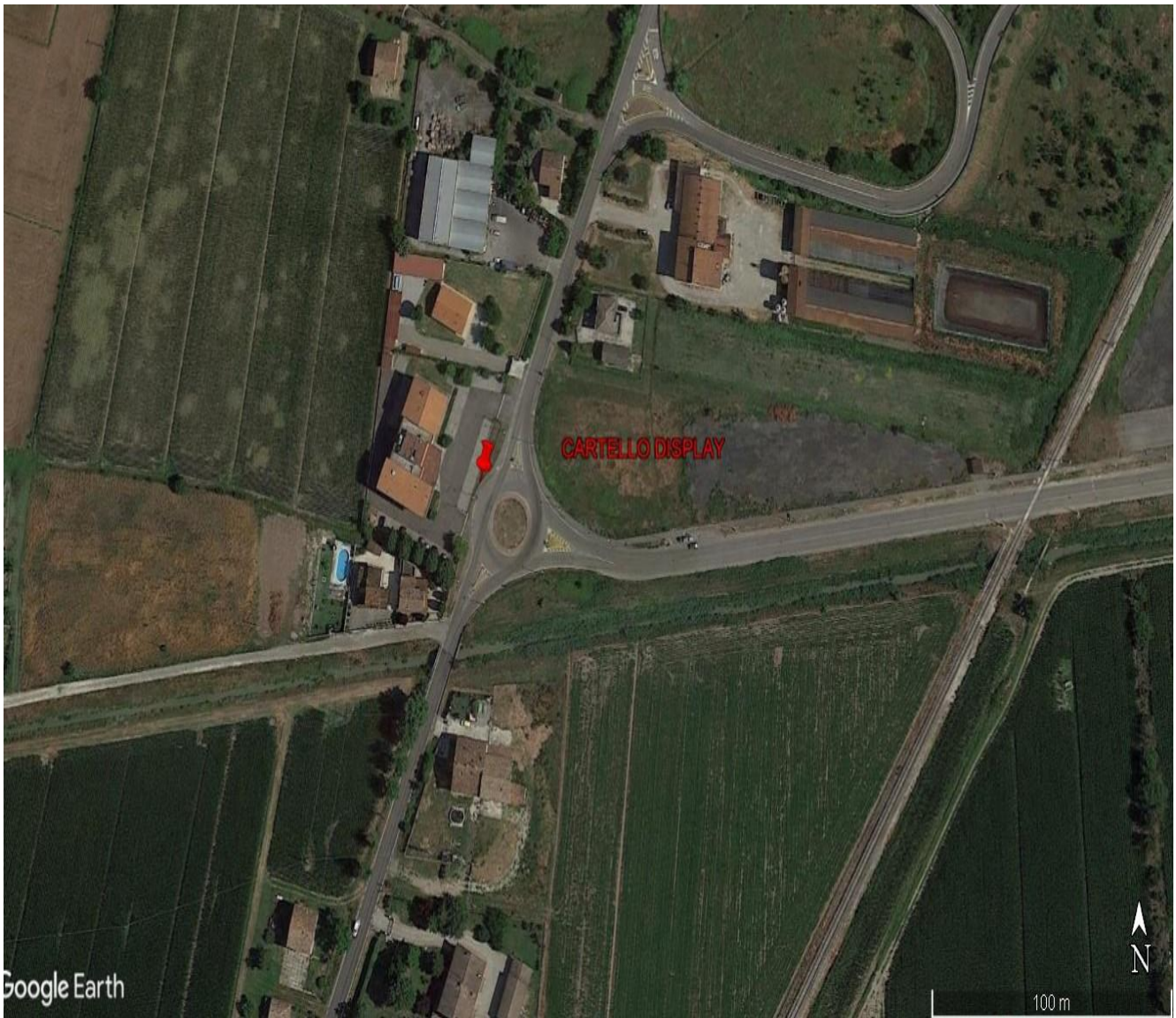
Foto 2: Ubicazione cartellonistica – lato Provincia di Reggio Emilia – S.P. 62R Km. 134+800